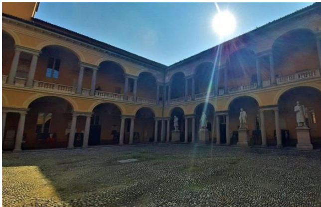
Università degli Studi di Pavia

Il complesso dell'Università di Pavia è davvero interessante e merita una visita. Diversi cortili con statue di autorità attraenti e una rilevanza storica che la rende una delle università più antiche del mondo. Infatti, fu fondata nel 1361 e molte personalità illustri, come Ugo Foscolo o Alessandro Volta, hanno insegnato qui. Oggi tante iniziative e manifestazioni, anche per i più piccoli, sono organizzate nei suoi cortili.