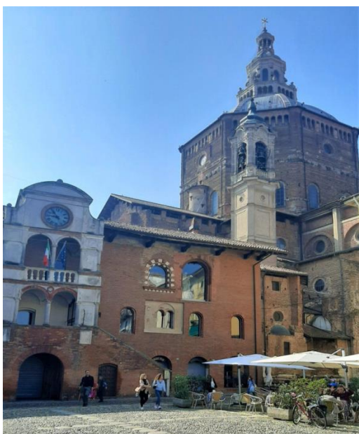
Piazza della Vittoria con il Duomo e il Broletto

Simbolo per eccellenza di Pavia è caratteristico perché è completamente coperto e ha la funzione di collegare il centro storico di Pavia a Borgo Ticino. La sua struttura è costituita da cinque arcate, una piccola cappella al centro e a un'estremità una targa commemorativa di Albert Einstein che passò di qui. È chiamato anche Ponte Vecchio poiché si presume che abbia antiche origini romaniche. In seguito fu distrutto durante la Seconda Guerra Mondiale e poi ricostruito nel 1949.